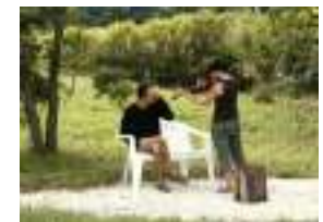
Musique à la rotonde