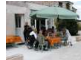
Terrasse avec salon de jardin et barbecue

Pour un séjour de dépaysement dans le calme de la campagne tourangelle. Pour une ou plusieurs nuits, de la bonne autonomie à la grande dépendance, tout est prévu pour vous offrir un confort optimal. Idéalement situé à environ 30 mn de la plus part des sites touristiques ( voir au verso )