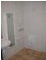
Une salle de bain adaptée