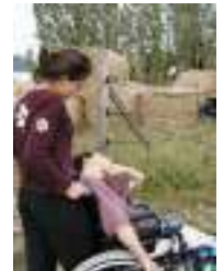
Visite aux chevaux dans les prés