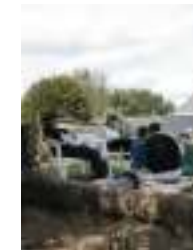
Moment de repos dans le parc